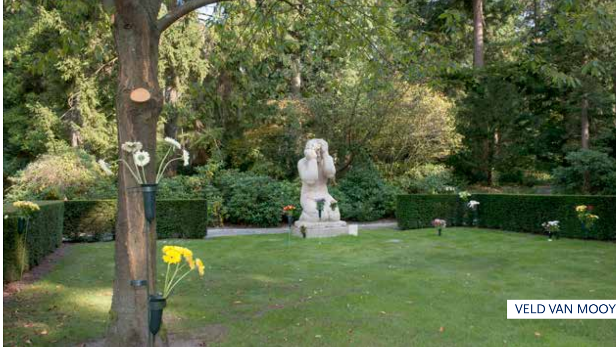
VELD VAN MOOY